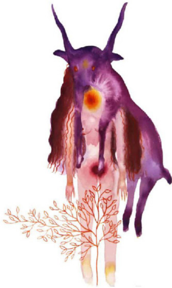
Stella Gujin-La-Gorcière - Aquarelle-sur-papier