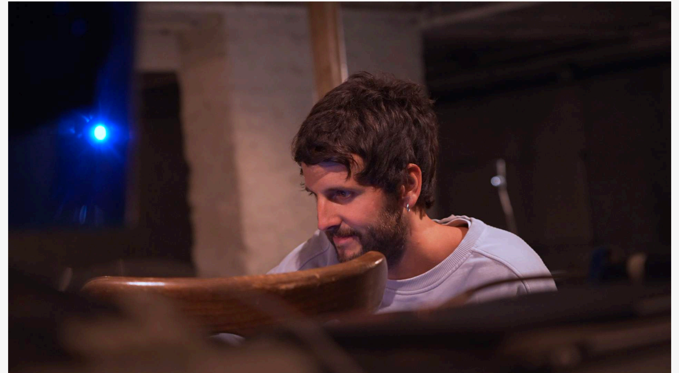
Résidence au Théâtre Gérard Philippe, Saint-Denis Septembre 2022

Il danse dans THEBADWEEDS (2023) dirigé par Rocio Berenguer au Théâtre de La Ville et en tournée européenne. Il co-écrit et interprète avec Riad Gahmi la mini web-série Start Up Nation (2021) et son adaptation en format plus long LICORNE réalisées par Alex Mesnil.