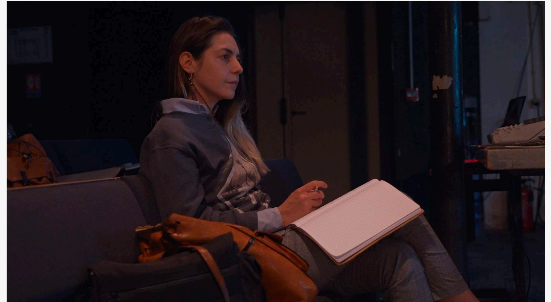
Résidence au Théâtre Gérard Philippe, Saint-Denis Septembre 2022

Elle est pédagogue au Cours Florent Jeunesse de 2015 à 2021, au Préau CDN de Normandie-Vire pour les saisons 21/22 et 22/23 et intervenante à l'ESAD Paris en 2023.