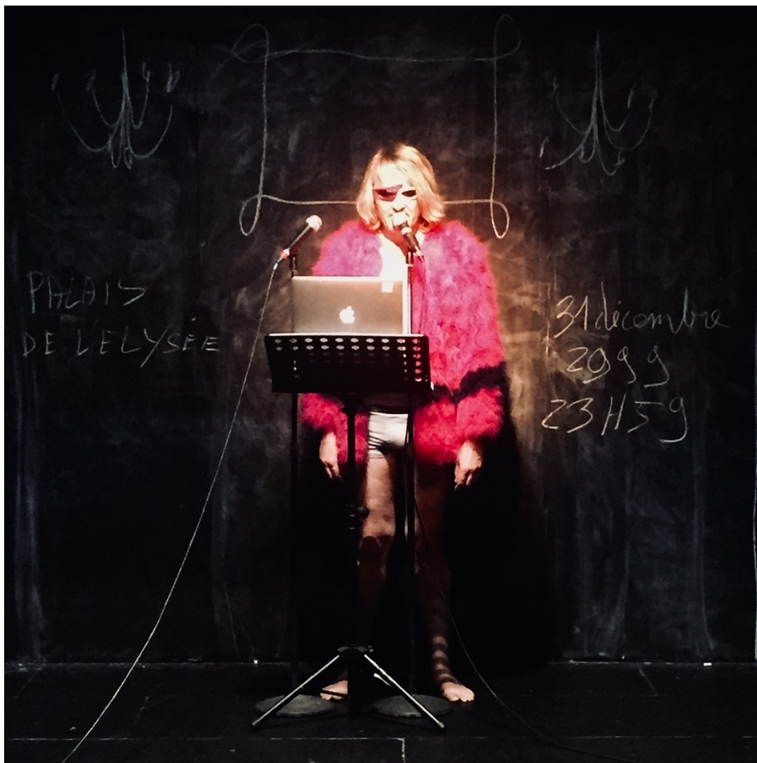
Larmes de crocodile, répétitions, Espace Ronde, Petit-Couronne.

Dessiner-écrire, danser-bouger, chanter-parler : il s'agit de faire nos premiers pas d'Hommes et de Femmes, ensemble, sans rivalité, avec au contraire beaucoup de complicité et d'amusement, et tenter un geste de réécriture de notre Histoire.