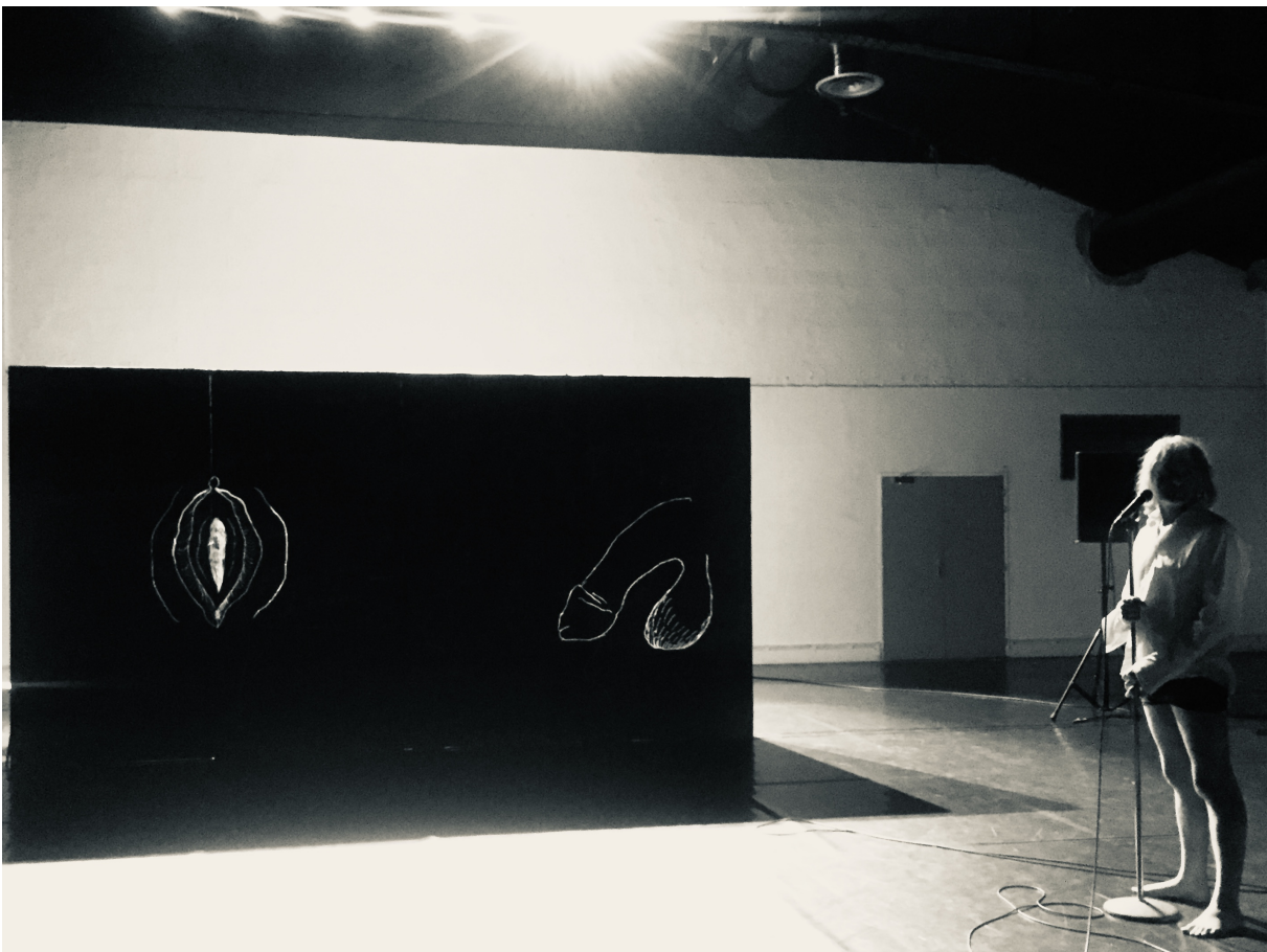
Larmes de crocodile, photo de répétitions, Halle aux Granges, Caen.