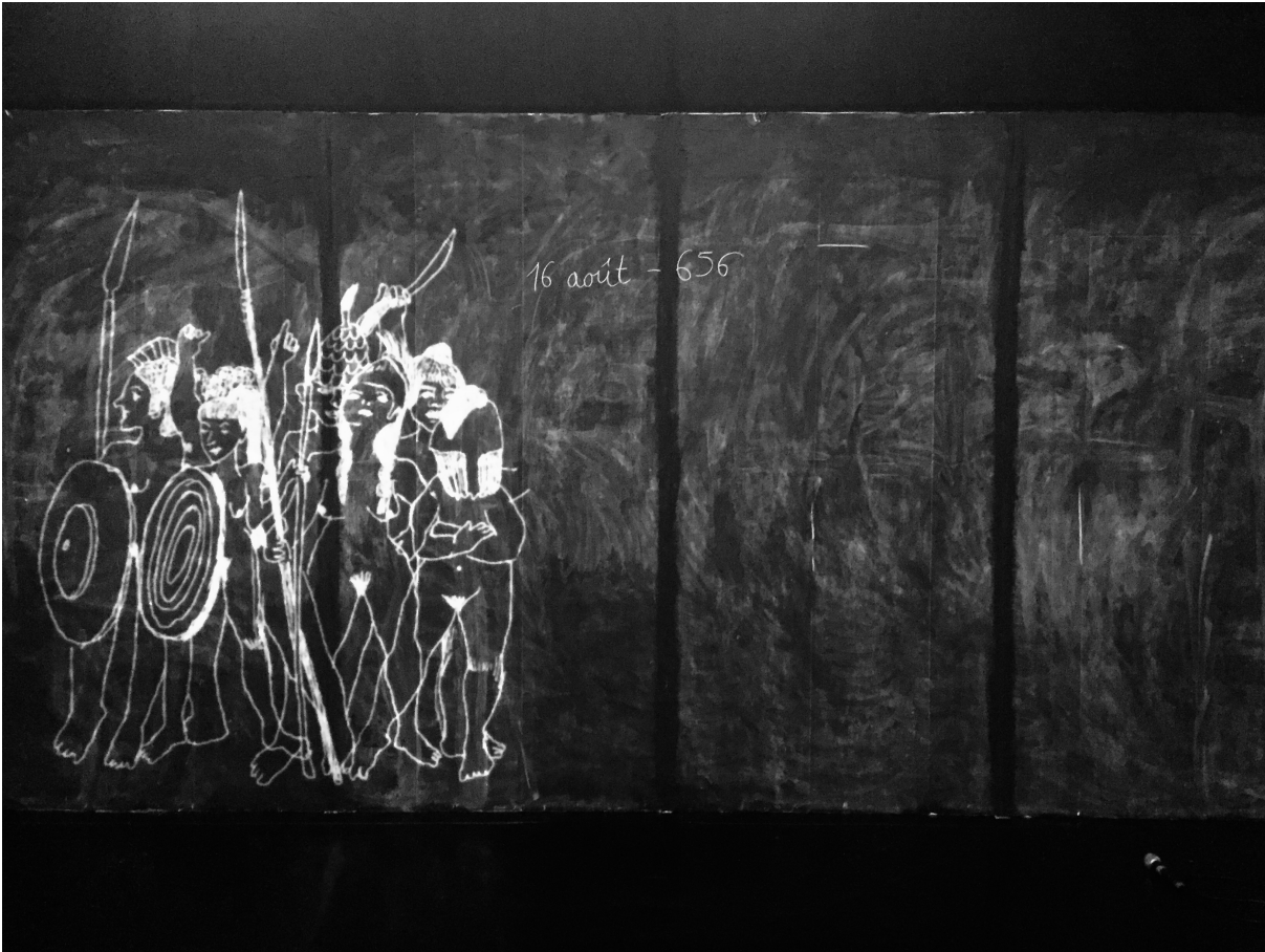
Larmes de crocodile, répétitions, Halle aux Granges, Caen.