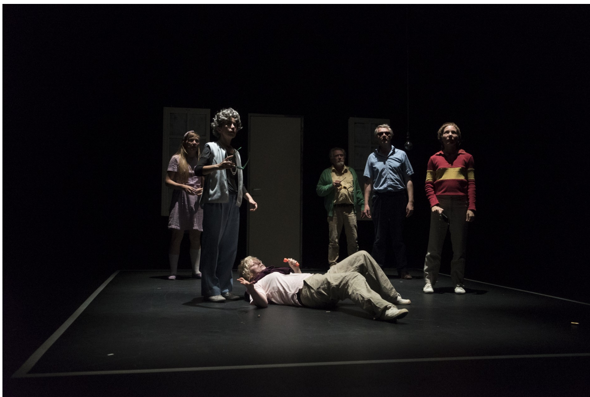
FROUSSE, photo Fred Hocké.

Par ailleurs, nous envisageons de mettre en place une version de « Larmes de crocodile » pour salles de classe, qui sera donc créée et jouée uniquement et spécialement dans des salles de classe, pour les élèves (en lycées essentiellement).