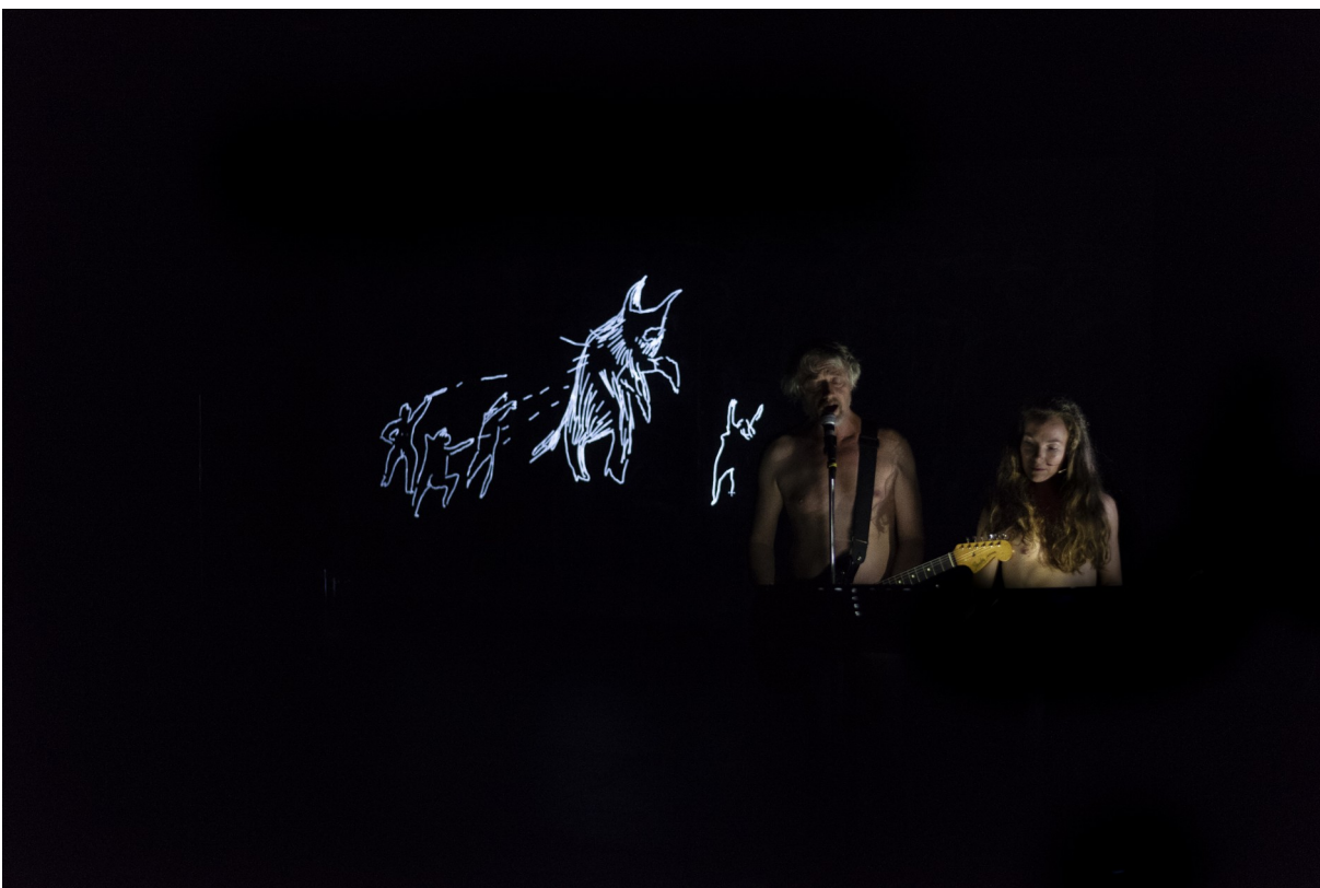
Larmes de crocodile