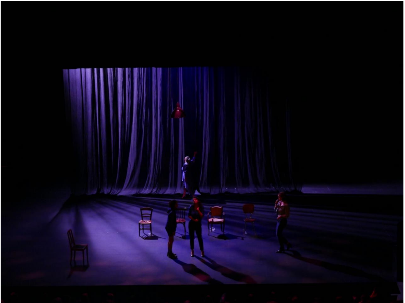
Photo de la représentation du 17/10/19 à l'ACB Théâtre de Bar-le-duc

Le démontage du matériel propre à la compagnie se fera à l'issue de la dernière représentation, durée environ 30 minutes. Si démontage du matériel technique prévoir 2 personnes en plus de la compagnie.